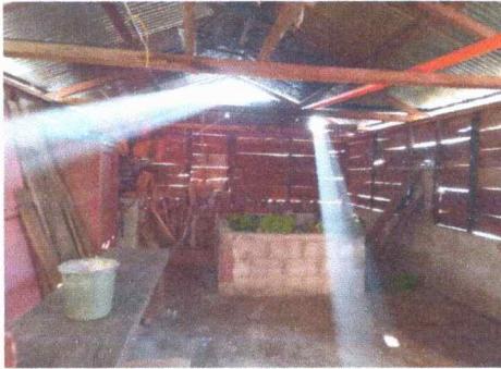
Foto1: Cambio de piso en cocina y culminación de paredes de cocina.